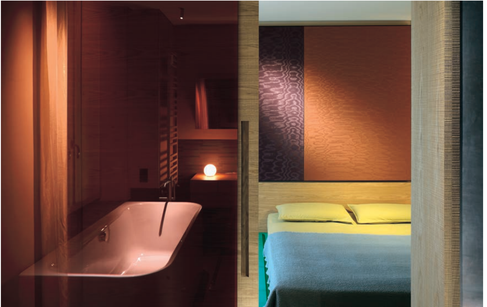
In questa pagina, bagno degli ospiti e zona notte, con libreria e letto su disegno, pannelli tappezzeria in tessuto Silvia Tessuti, Milano; faretti a soffitto Find Me di Flos.